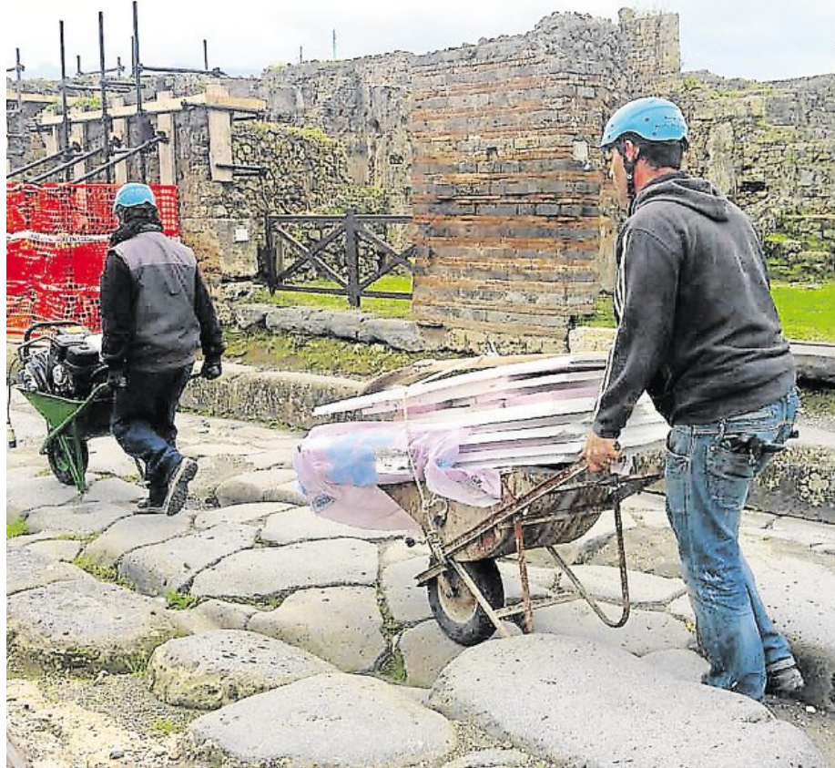
Des ouvriers parent au plus pressé pour préserver une maison. A droite, le site, dominé par le Vésuve ; des pancartes annonçant des travaux et la dépouille calcifiée d'un homme, tué par l'éruption du volcan, en 79 de notre ère.

Le site archéologique de Pompéi, classé au patrimoine mondial de l'Unesco, est-il en péril ? Les écroulements de murs de maisons antiques se sont multipliés ces trois dernières années. L'Italie a été rappelée à l'ordre par l'Union européenne.